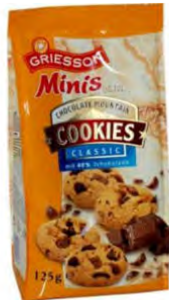
Griesson Mini Cookies 12 x 125 g Art. 88348