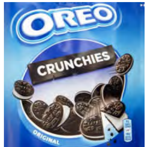
OREO CRUNCHIES Feine Stückchen 400 g Beutel Art.98278