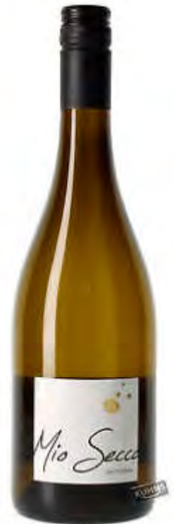
MIO Secco Frizzante Secco 6 x 0,75 l Art.96436

Himbeeren und viele weitere Früchte tiefgekühlt..