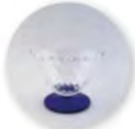
Art. Nr. 704030