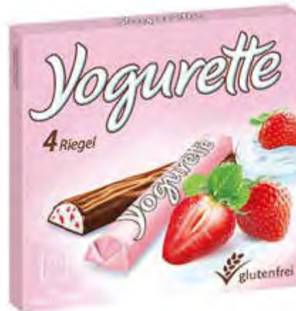
Yogurette 20 x 50 g/4 Riegel Art. 88346