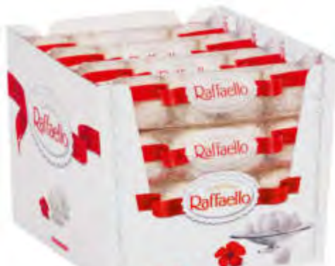
Ferrero Raffaello Riegel 16 x 40 g Art. 80703