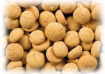
Amarettini Plätzchen 1 kg Art.98220