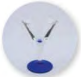
Art. Nr. 704020