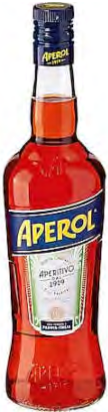
Aperol Aperitivo 0,75 l 11 % vol Art. 64000