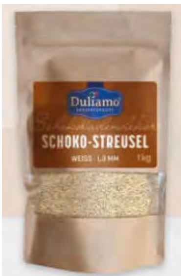
Schokostreusel WEISS 1 kg Art. 98268