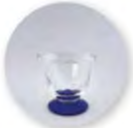
Art. Nr. 704028