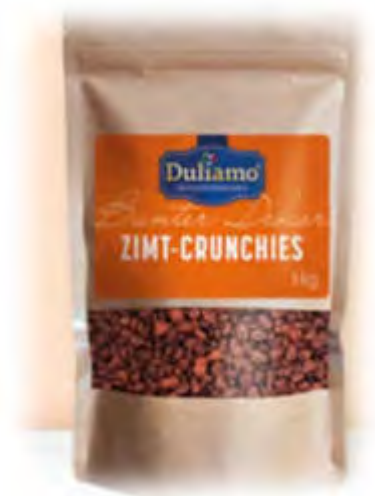
Zimt Crunchies 1 kg Art.98233