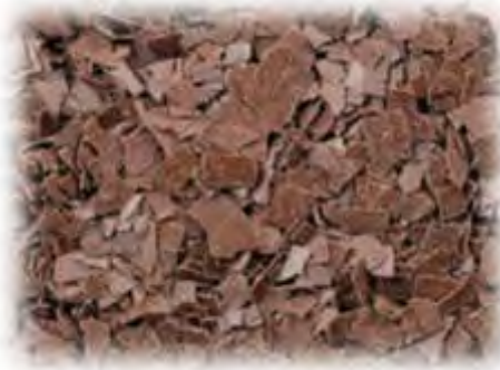
Schokoraspel „Schwarzwald“ 2 x 2,5 kg Art.98250