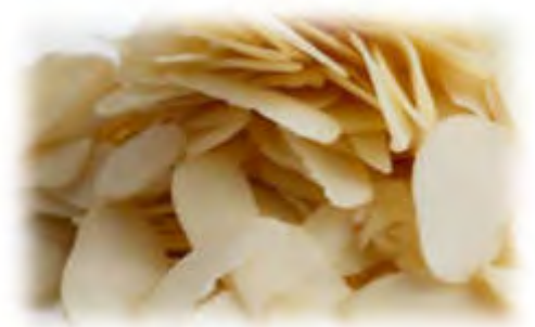
Mandeln gehobelt 1 Kg Art.98265