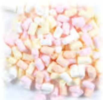
MINI Marshmallows 11mm 4-farbig Art.98259