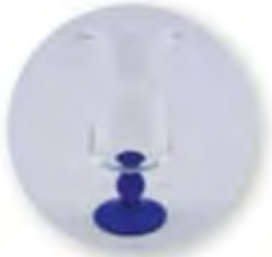
Art. Nr. 704026