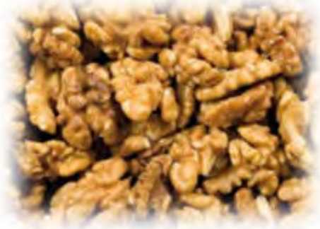
Walnuss BRUCH 10kg Karton Art.98277