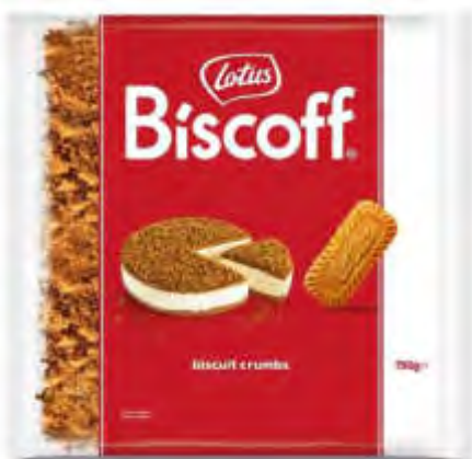
Lotus Biscoff CRUMBS 750 g Beutel Art.10011