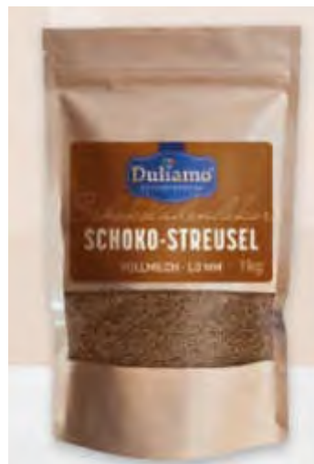
Schokostreusel VOLLMILCH 1,3 mm 1 kg Art.98257