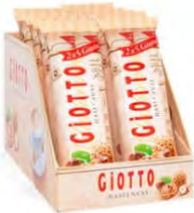
Giotto Haselnuss 2er 10 x 21,5 g Art. 88347