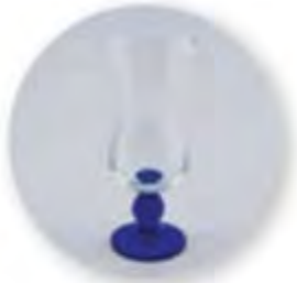
Art. Nr. 704024