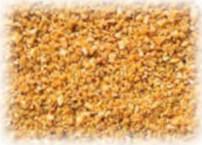
Haselnuss-Krokantstreusel Kaliber 2-4 mm 2 x 2,5 kg Art.98210