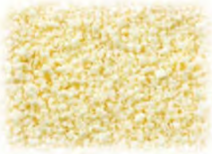
Raspel weiß „Parmesan“ 2 x 2,5 kg Art.98260