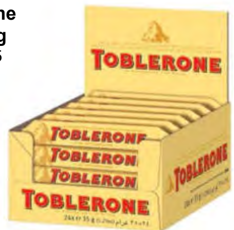
Toblerone 24 x 35 g Art. 88345