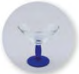
Art. Nr. 704014