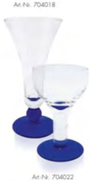
Art. Nr. 704018