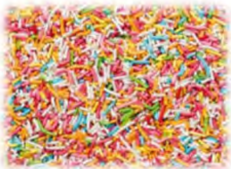
Bunte Streusel 1 kg Art.98280