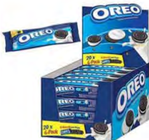
OREO 6-er Riegel 20 x 66 g Art. 81114