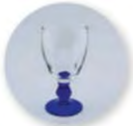
Art. Nr. 704010