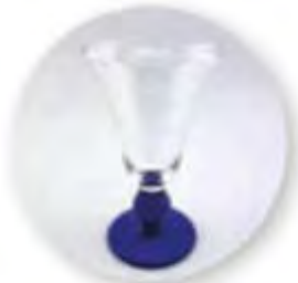
Art. Nr. 704012