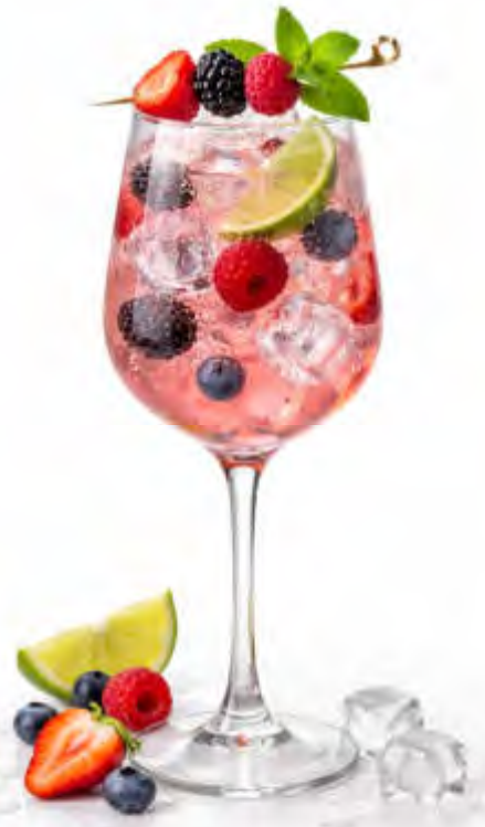
Inflagrante Secco 6 x 0,75 l Art.96435