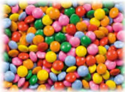
Mini Schoko Linsen 1 kg Art.98270