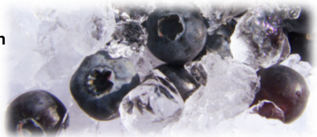
TK Johannisbeeren 4 x 2,5 kg Rot; Art.10490 Schwarz Art.10495

Viele weitere tiefgekühlte Früchte ständig an Lager