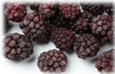
TK Brombeeren 4 x 2,5 kg/Karton Art.10480

Viele weitere tiefgekühlte Früchte ständig an Lager