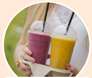
AUCH ALS TO GO